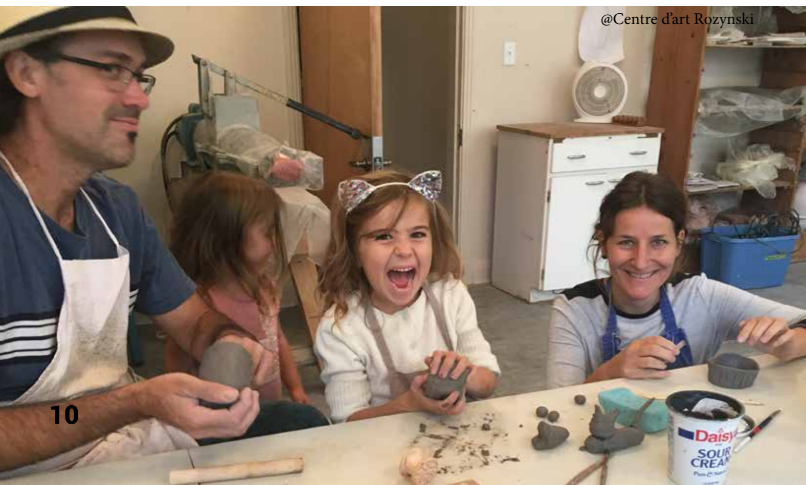
@Centre d'art Rozynski